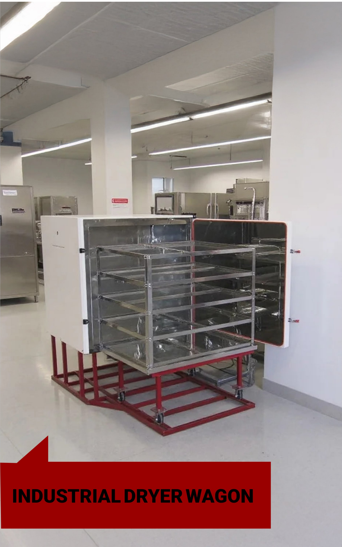
INDUSTRIAL DRYER WAGON